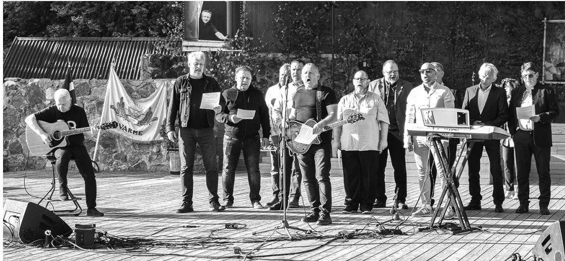
Koncerta Dižais dzīvē un mākslā dalībnieki gan muzicēja, gan dalījās atmiņās par Šefu.