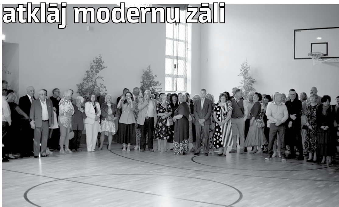
Absolventi, kādreizējie un tagadējie darbinieki aplūko tikko atjaunoto sporta un citu pasākumu zāli I. Zeberīna Kuldīgas pamatskolā.

Daina Tafelberga Jēkaba Aleksandra Krūmiņa foto