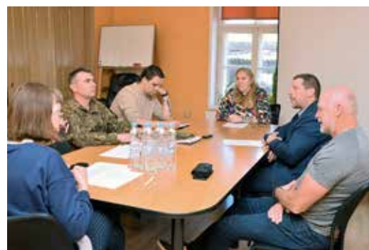
Vai krīzes situācijām esam gatavi? Diskusija.