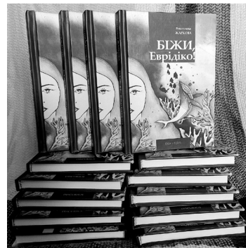
Šogad iznākušajā stāstu krājumā Skrien, Eiridike! viena no galvenajām tēmām ir kara traumas, migrācija, it īpaši sieviešu pieredze.

Mūsu tikšanās notiek Ventspilī Rakstnieku mājā, un viņa rokās tur grāmatu Skrien, Eiridike! , kas iznākusi pavisam nesen – aprīlī. Tajā publicēts arī Baltijas ekspresis . „Grāmatā ir divas daļas. Vienai esmu devusi nosaukumu Zeme, otrai – Jūra ,” skaidro rakstniece. Baltijas ekspresis ir viens no stāstiem, kas vēsta