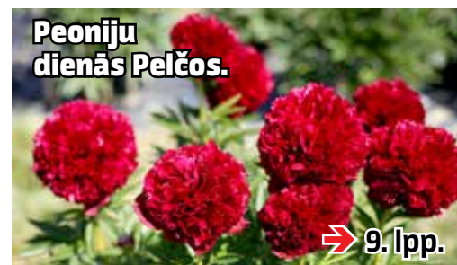
Peoniju dienās Pelčos.