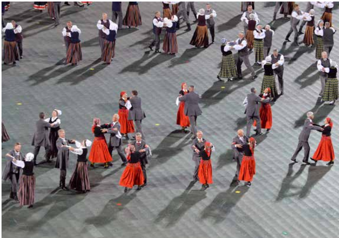
Daugavas stadionā kopā ar daudzajiem dejotājiem rakstus izdejo arī senioru kolektīvs Kuldīdznieks .

Koncertam bija spēcīgs nobeigums. Vīzija, ko emocionāli uzbūra veidotāji: meita laukumā starp tūkstošiem dejotāju. Man radās sajūta – uz laukuma ir mana meita. Man patīka, ka beigās pievienojās virsvadītāji un skatītāji varēja arī viņus redzēt dejojām.