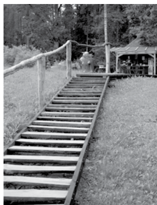
Atjaunotās ozolkoka kāpnes.