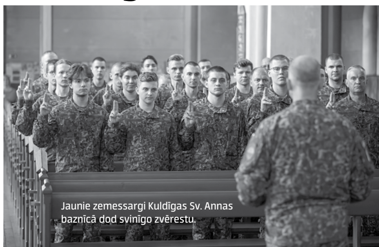
Jaunie zemessargi Kuldīgas Sv. Annas baznīcā dod svinīgo zvērestu.

Karavīriem un zemessargiem pasniegti apbalvojumi. Pulkvedis