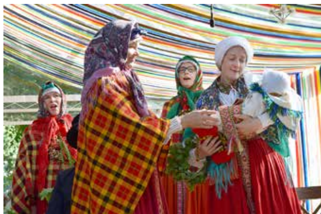
Etnogrāfiskais ansamblis Gudenieku suiti rāda rituālu Pādes dīdišana , kurā mazu bērniņu iešūpo un izdzied visa laba vēlējumus.