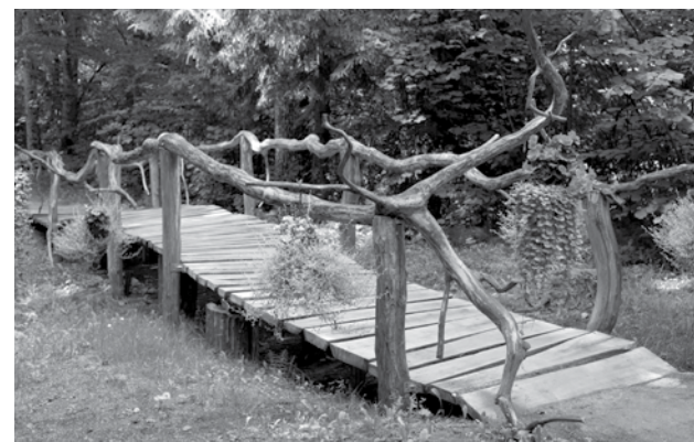
Atjaunotais ozolkoka tiltiņš.