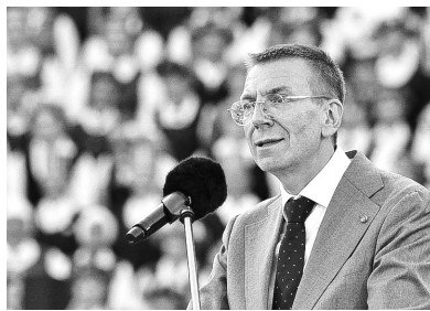
Valsts prezidents Edgars Rinkēvičs.

„Tikai kopā augšup un kopā tālāk – vienā elpā, vienā dziesmā un vienā dejā – mēs spējam būt un spējam celt mūsu mīlo un vienīgo Latviju,” tā savā uzrunā Dziesmu un deju svētku noslēguma koncertā Kopā augšup Mežaparka estrādē svētdien sacīja jaunais Latvijas prezidents Edgars Rinkēvičs.