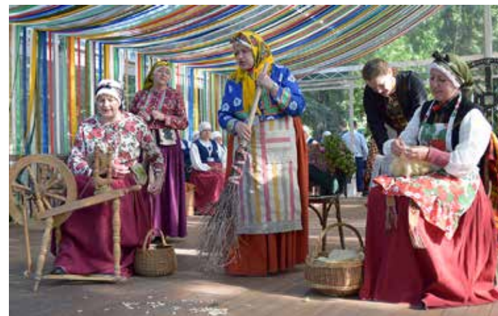
Etnogrāfiskais ansamblis Basu suiti izspēlē sadzīves ainiņu ar ikdienas darbiem.

tērpusies Basu mājas tērpā: „Katrai ir sava aube un savs tērps, kā nu kura pa smuko gājusi uz kāzām, baznīcu un kur tik vēl ne.” Viņas rādot to daļu no skates, kas žūrijai neesot patikusi: „Parādījām, kā rit mājas dzīve, tāpēc līdzi ir slota,